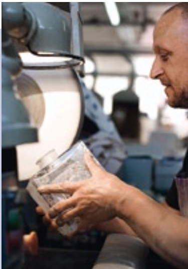
HANDARBEIT Produziert wird bei Lalique wie zu Grossvaters Zeiten.

KLEINSTSERIEN. 2005 verkaufte die Familie Taittinger Baccarat an Barry Sternlichts Starwood-Hotelkette. Der Superhotelier (Motto: «We are going to make each hotel obscenely rich and obscenely beautiful») erkannte, dass sich mit dem mythischen Namen mehr als Kristallglas machen liess. Derzeit zieht er unter dem