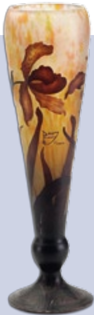
FARBREIGEN Der Lampenfuss Violette Iris ist typisch für Daum – buntes Glas in floraler Form.