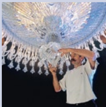
GROSSER LUXUS Kristalleuchter von Baccarat.