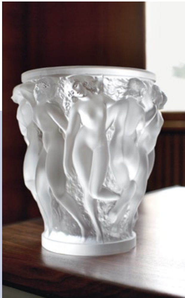
VERMÄCHTNIS Frauen, Fauna und Blumen waren die grosse Passion des Firmengründers René Lalique. Seine Vase Bacchante von 1927 ist bis heute die am meisten verkaufte Kreation.